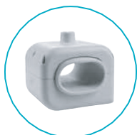
MÃO / PULSO