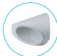
TORNOZELO / PÉ